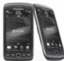
Blackberry 9860 SPECIAL PRICE

SALES, REPAIR AND ACCESSORIES FOR ALL BLACKBERRY MODELS AND OTHER CELLULARS